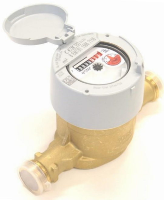
V200 – R 3/4 " Standard utførelse NRF-nummer 4023969