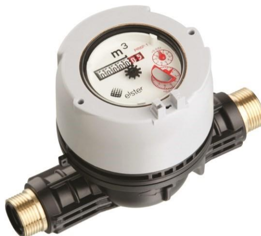
V200P – R 3/4 " Polymer utførelse NRF-nummer 4022924