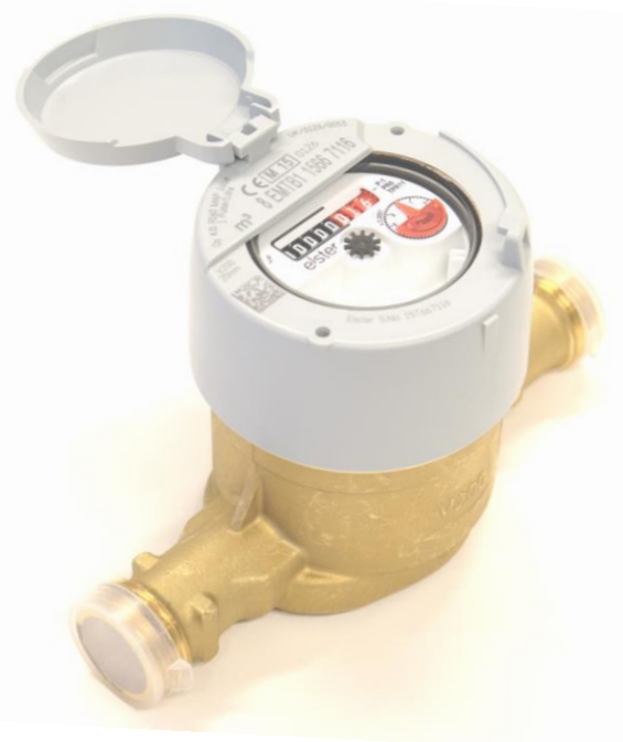
V200 – R¾" Standard utførelse NRF-nummer 4023969