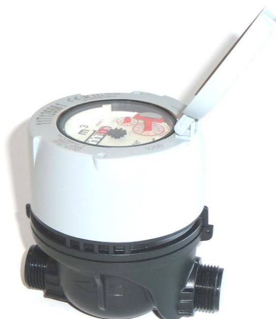
Type V200 – Polymer utførelse R½" x 110mm – Q 3 = 2,5 m 3 /h