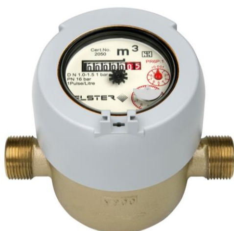
Type V200 – Standard utførelse R½" x 110mm – Q 3 = 2,5 m 3 /h